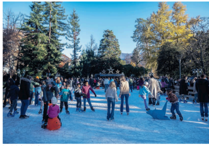
La principale novità di quest'anno

Mercatino prolungato e Capodanno 'light' Gli accorgimenti dei quali parla Badaracco hanno riguardato principalmente il veglione di San Silvestro. «Il famoso palco in piazza Manzoni è stato uno dei cambiamenti che ha interessato questa edizione. La formula che abbiamo adottato, senza il concerto del 31 dicembre ma con un palchetto per i di in piazza Riforma ha funzionato benissimo e con l'animazione di Rete Tre, anche durante il Capodanno c'era moltissima gente. Il risparmio è stato importante, ma anche con questa nuova formula la festa per salutare l'anno nuovo non è mancata. Per alcuni forse - aggiunge - è stato addirittura meglio così, dato che il palco creava un po' di serratamento». Particolarmente apprezzato anche il prolungamento del mercatino fino a dopo il Natale. «Questa scelta ha reso contenti tutti, dai cittadini ai turisti, agli esercenti e agli albergatori. E contenti