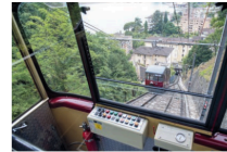
Vanno in pensione

Infine, ieri, a Lugano è stata una giornata dedicata anche a un ultimo viaggio storico. Quello delle carrozze della Funicolare Monte Brè, che dopo quarant'anni di servizio si apprestano ad andare in pensione. Per festeggiare questo traguardo e salutare le carrozze che hanno accompagnato generazioni di viaggiatori, la Funicolare ha deciso di regalare un'ultima corsa. In vetta i Re Magi hanno accolto i curiosi per un ultimo momento di tradizione e magia.