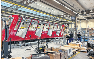
Gli ultimi dettagli.